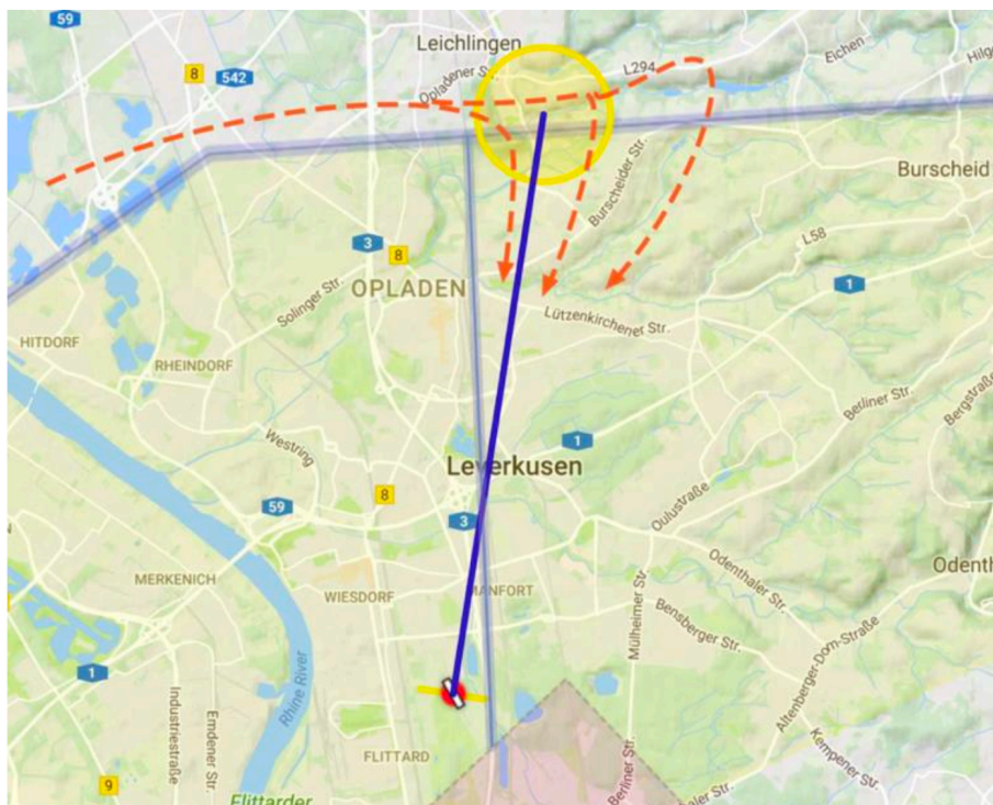
Abbildung 1. Zielanflug auf Leverkusen nach Überfliegen des Zielkreises „002Zielkreis“. Der Zielkreis befindet sich kurz vor der Begrenzung des Luftraumes C (2500 ft = 762 m MSL) in 650 m MSL.

Hinweis: Der Zielkreis ist derart ausgelegt, dass nach dem erfolgreichen Überflug, in aller Regel ausreichend Höhe für das sichere Erreichen des Flugplatzes Leverkusen gegeben ist. Sollte die Zielkreishöhe nicht erreicht werden, gibt es im Bereich des Zielkreises Außenlandemöglichkeiten oder die Alternative am Flugplatz Langenfeld zu landen.